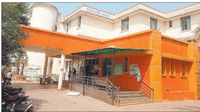
सामुदायिक स्वास्थ्य केंद्र।

विकासखंड उदयपुर के एक मात्र आदिवासी बहुल इलाकों का सामुदायिक स्वास्थ्य केंद्र है जो जो वर्षों पुरानी और एकआरयू सेंटर का दर्जा प्राप्त है। सामुदायिक स्वास्थ्य केंद्र में विकास खंड के 92 गांव के लोग इलाज करवाने पहुंचते हैं। इसके अलावा प्रेमनगर, लखनपुर विकासखंड के गांवों के लोग इलाज करवाने आते हैं। नेशनल हाईवे पर दुर्घटना के गंभीर मरीज भी आए दिन पहुंचते जिससे अस्पताल लोगों के लिए जीवनदायिनी बन चुकी है। लेकिन शासन, प्रशासन द्वारा स्वास्थ्य के क्षेत्र में लाखों