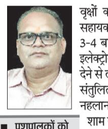
पशुपालकों को विशेष सावधानी बरतनी की सलाह